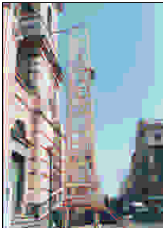
Figura A.1: costruzione della struttura del Carro.

Il Carro, nella sua struttura interna, ricorda la classica configurazione a ‘croce di Sant’Andrea’, tipica dei tralicci dell’alta tensione (Figura A.1).