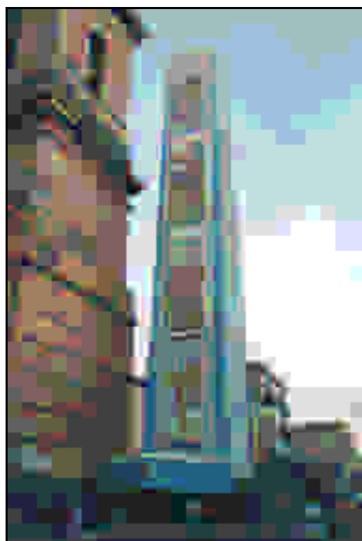
Figura A.2: il pannello anteriore ed uno dei laterali.

La facciata anteriore, sempre divisa in quattro pannelli, illustrerà il tema riportato nell’Articolo 2 del bando, secondo lo schema che segue.