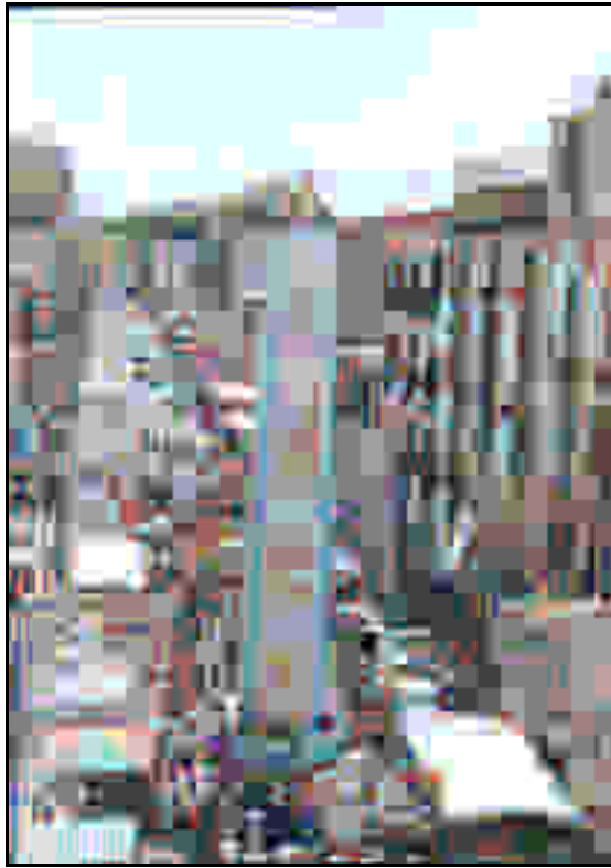
Figura A.3: Carro in processione.